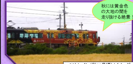
QRトレイン(秋11月頃)/イメージ