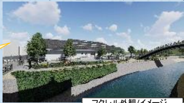
フクレル外観/イメージ