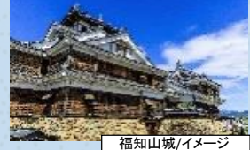
福知山城/イメージ

丹波を平定した明智光秀が城と城下町を築きました。築城当時から残る個性豊かな石垣と、北近畿唯一の天守が魅力。