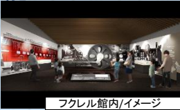
フクレル館内/イメージ