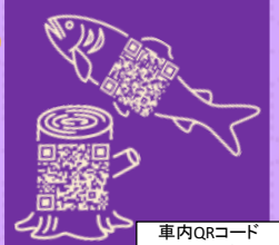
車内QRコード/イメージ